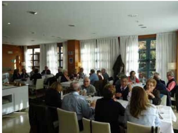
DELEGACIÓN DE VALENCIA