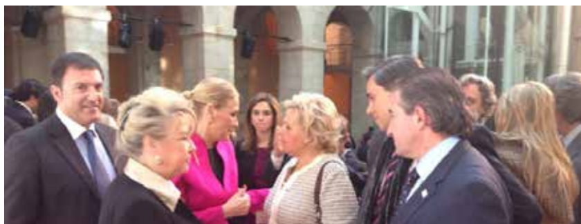
Acto de la Comunidad de Madrid con motivo del día de la Constitución Española.

El día 27 de octubre, la sociedad española acompañó a las víctimas del terrorismo bajo el lema Justicia para un final con vencedores y vencidos en la concentración convocada por la AVT en la madrileña Plaza de Colón para manifestar su repulsa contra la derogación, a manos del Tribunal Europeo de Derechos Humanos de Estrasburgo, de la ‘doctrina Parot’.