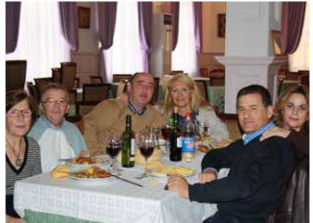
DELEGACIÓN DE EXTREMADURA