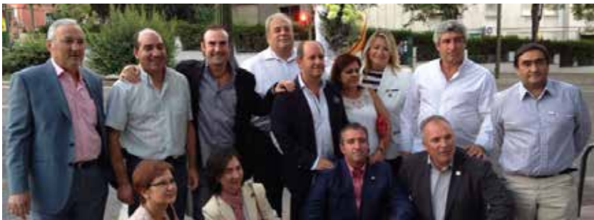
Homenaje a las víctimas en la Plaza de República Argentina (Madrid).