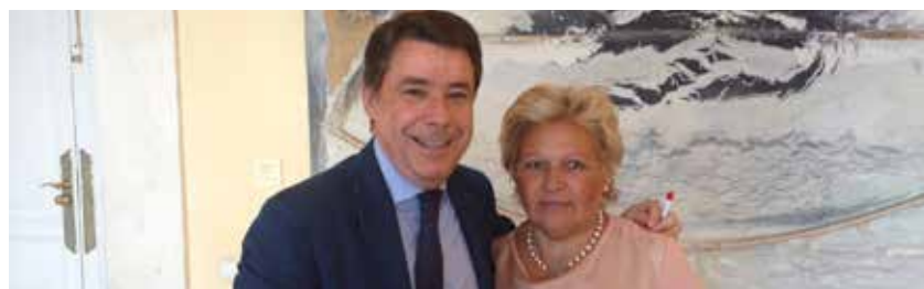
Encuentro con Ignacio González, presidente de la Comunidad de Madrid.