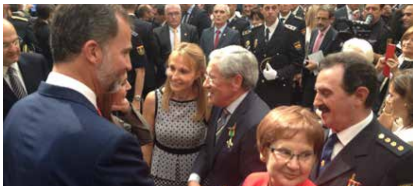
Actos Día de la Policía en Alcalá de Henares (Madrid)

revisar las actividades desarrolladas y programar nuevos proyectos que repercutan directamente en el bienestar del colectivo de asociados y de la AVT.