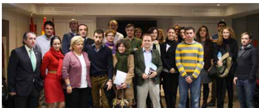
Tradicional encuentro con periodistas en la sede.