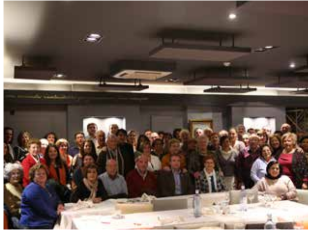
DELEGACIÓN DE MADRID