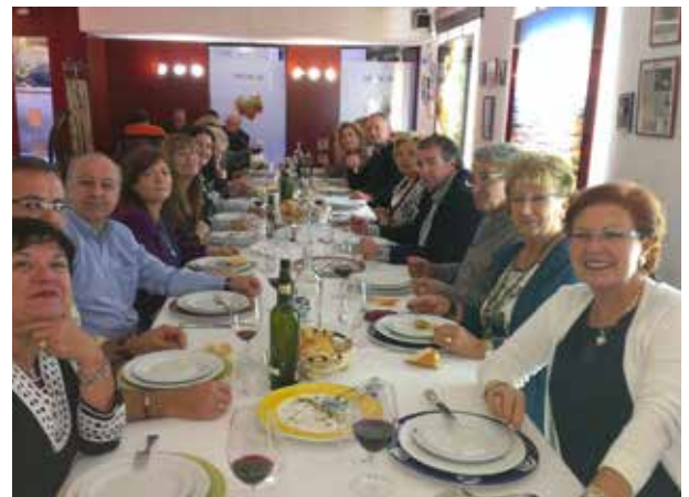
DELEGACIÓN DE LA RIOJA

Todas las noticias y actividades de las diferentes delegaciones de la AVT las puedes encontrar en: