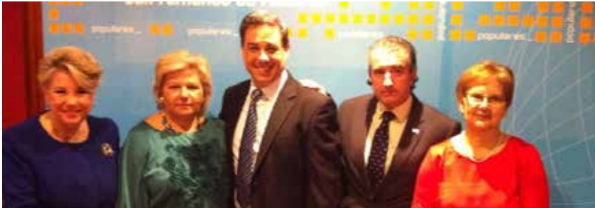
Cena benéfica en San Fernando de Henares (Madrid).