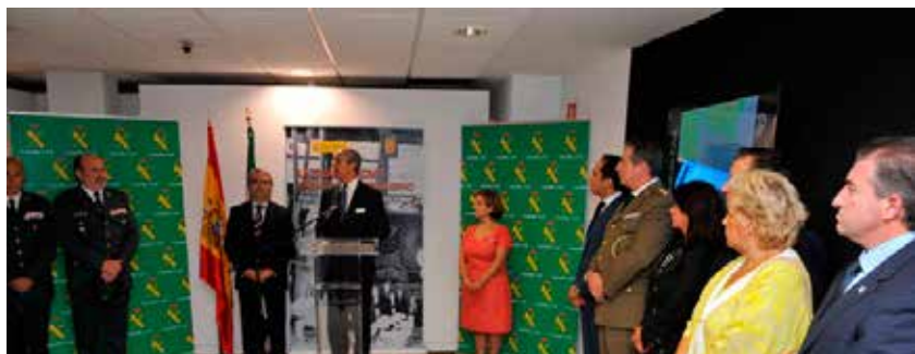
Inauguración de la exposición "La Guardia Civil frente al terrorismo".