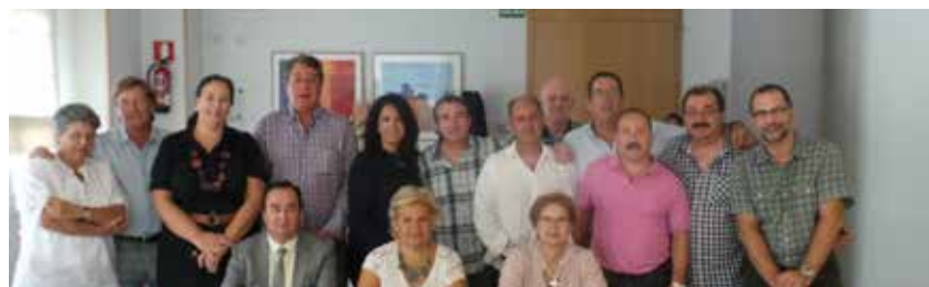
Reunión de la Junta Directiva y delegados de la AVT.

También han sido una constante, las reuniones con diferentes cargos de la Junta de Distrito de Moratalaz así como con diferentes asociaciones de la zona donde se