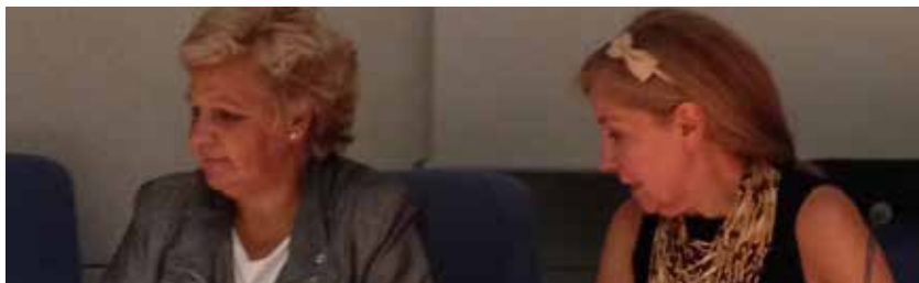
Conferencia en el Colegio de Psicólogos de Madrid.