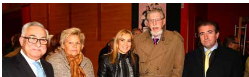
Concierto de la Constitución en el Teatro Francisco Rabal de Pinto.