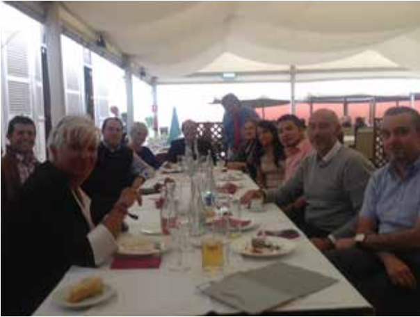
DELEGACIÓN DE LAS PALMAS