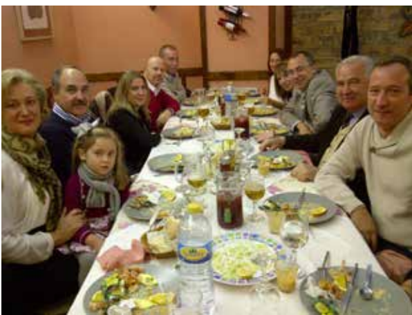
DELEGACIÓN DE GRANADA