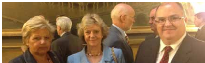
Acto trigésimo aniversario del Defensor del Pueblo en el Congreso.