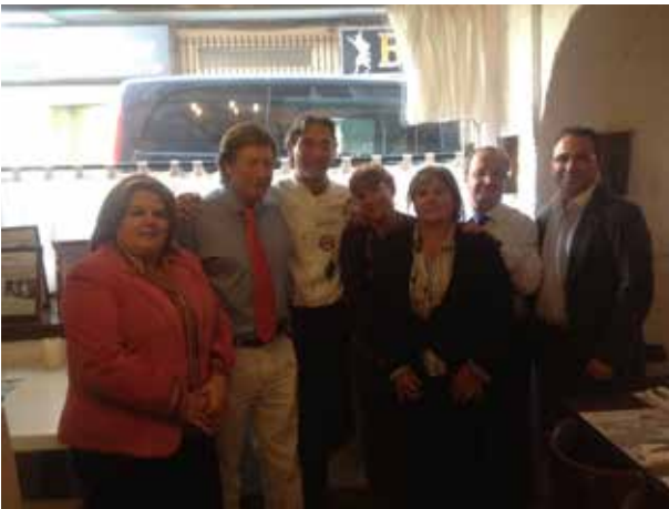
DELEGACIÓN DE TENERIFE