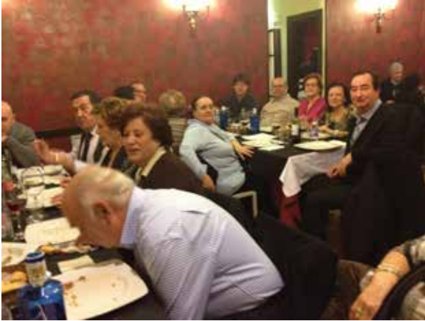
DELEGACIÓN DE ARAGÓN