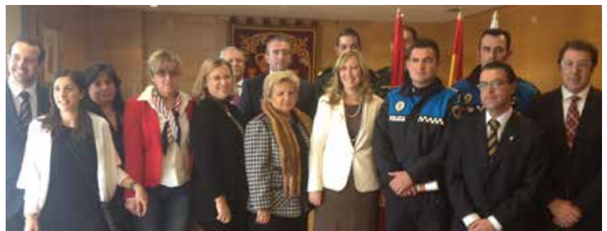
Acto institucional en el Ayuntamiento de Soto del Real.